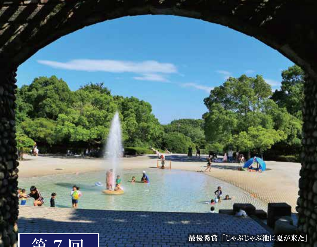
最優秀賞「じゃぶじゃぶ池に夏が来た」