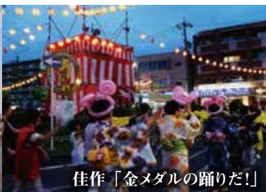
佳作「金メダルの踊りだ!」