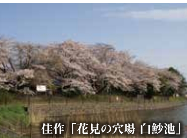
佳作「花見の穴場 白紗池」